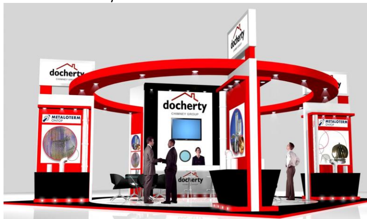
Stand van Docherty

Op dit evenement zal Docherty Chimney Group een nieuwe stand hebben, met nummer B31, waar de Metaloterm® producten zullen worden gepresenteerd, waaronder het unieke Metaloterm® UP systeem.