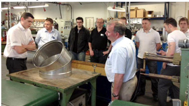
Fabrieksrondleiding met Docherty